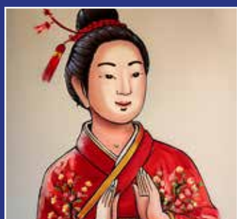
KINESISK SIDE 16