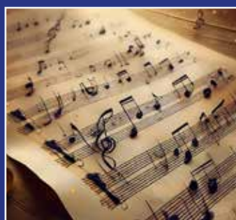
KOR SIDE 19