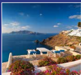
GRÆSK SIDE 15