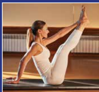
PILATES SIDE 12