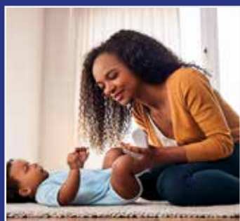
BABYRYTMIK SIDE 11