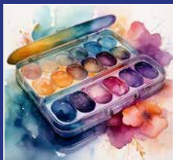
AKVARELMALING SIDE 8