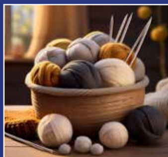
STRIKNING SIDE 9