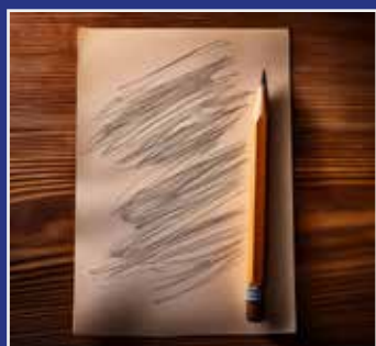
BLOGSKRIVNING SIDE 10