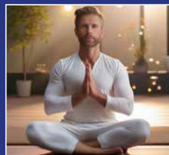
YOGA SIDE 13