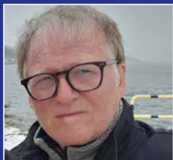
ONSDAGSKLUBBEN SIDE 3