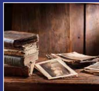
SLÆGTSFORSKNING SIDE 10