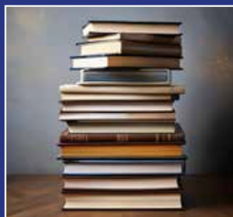
BOGKLUBBEN SIDE 5