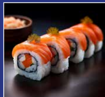
SUSHI SIDE 6